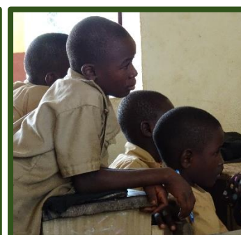
Aandacht tijdens Bijbelverhaal