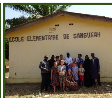
Op de foto met de directeur en leerkrachten