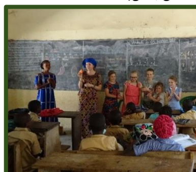
Liedje aanleren in het Frans