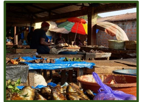
Markt in Boké

Het geloof van de mensen hier is vermengd met hun dagelijkse leven. Vijf keer per dag klinkt de gebedsoproep. Velen leggen dan hun werk even neer om te gaan bidden. Zo gebeurde het dat ik boodschappen aan het doen was en nog even stond na te denken over mijn keuze, toen de vrouw van het boetiekje zei: 'Ben je klaar? Dan kan ik gaan bidden.' Ik voelde wel dat ik snel mijn keuze moest maken en haar verder met rust moest laten. Het geloof wordt hier niet onder stoelen of banken geschoven. Een spiegel.